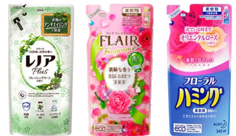
図1 「売れ筋商品ランキング」上位3商品

当ランキングの1位は抗菌防臭効果で、ニオイの原因となる菌の増殖を防ぐP&Gの『レノアプラス フレッシュグリーン 詰替え 480ML』でした。2位は花王の『フレア フレグランス フローラル&スウィート つめかえ用 480ML』。汗や動きによって香りがわきたち、抗菌・防臭効果もあります。3位の花王『フローラルハミング 濃縮タイプ オリエンタルローズ つめかえ用 540ML』は、持続性の高い香り成分が配合されており、香りが長続きするほか、衣類にタバコや汗などのニオイがつくのを防ぐ効果もあります。(図1)