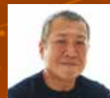
佐々木 俊尚 (ささき としなお) 作家・ジャーナリスト

コロナ禍は落ち着きを見せてきたものの、世界各地の紛争は収束せず、経済情勢も不透明な状態が続いている。先を見通すにはどのような情報収集力が求められるのか。作家・ジャーナリストの佐々木俊尚氏が、確かな世界観を磨くための読書術といま読んでおきたいビジネスリーダーのための厳選5冊を紹介する。