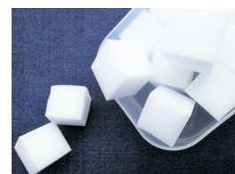
メラミンスポンジ (※4)。

梅雨は水回りにカビが生えたり、雑菌が繁殖しやすい季節。中でもキッチンスポンジは菌の温床と言われます。そこで今回は、「キッチンスポンジ」についてアンケートを実施。スポンジの交換頻度や、衛生的に使うためにどんなお手入れをしているか、スポンジへのこだわりなどをまとめました。