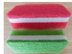
ウレタンやナイロン不織布 素材の一般的なスポンジ (※1)。